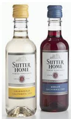
SUTTER HOME, KALIFORNIA