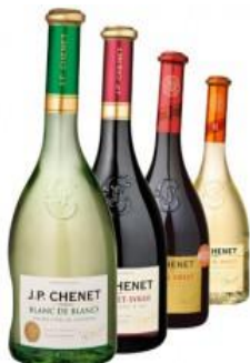
J.P. CHENET, FRANCJA